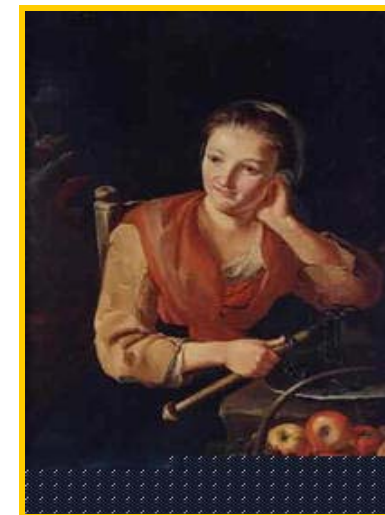
Giacomo Francesco Cipper detto il Todeschini "Venditrice di frutta"